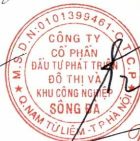
Trần Việt Dũng